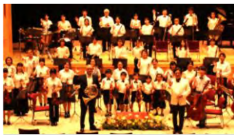
チェコ・フィル首席ホルン奏者&指揮者グラベツ氏と共演

琉球フィルが運営する「那覇ジュニアオーケストラ」は、2013年10月より活動をスタートしました。団員是那覇市および県内各地の小学生から高校生で構成され、学校や学年の垣根をこえて「思いやり」と「感謝の心」を大切に、音楽活動を行っています。指導者には、琉球フィルハーモニックオーケストラのメンバーを中心に、プロの指揮者や演奏家を招き技術と音楽力の向上に努めています。これまでに1年間の練習成果を披露する定期演奏会の開催をはじめ、多くの演奏会等に出演。2016年には「第6回世界のウチナーンチュ大会」に出演。2015年より「ウィーン・フィル&サントリー音楽復興祈念賞」を6回受賞し、東日本大震災を風化させないことと、音楽による子どもたちの交流を目的に、2016年・2018年・2022年は沖縄県で、2017年と2019年に宮城県で『「響け！復興へのハーモニー～つながる未来～」岩手・宮城・福島・沖縄の子どもたちによる合同オーケストラコンサート』を開催しました。2020年には『いのちよ響け「奇跡のピアノ」沖縄コンサート～さとうきび畑とともに～』に出演。2020年、2021年にはハワイ州観光局支援のもと「ハワイ・ユース・シンフォニー」のチャリティコンサート「The Gift of Music」に、ハワイと日本の5つの姉妹都市のジュニアオーケストラとしてリモートによる共演に参加し、その模様はハワイのテレビ局KHNLの番組「Hawaii News Now」で放送されました。また、病院や施設などでの慰問演奏や、世界で活躍している一流音楽家との交流も行うなど、活動も多岐にわたっています。子どもたちは音楽をととした多様な体験により、心の豊かさを育み、喜びを分かち合える仲間の輪が広がっています。