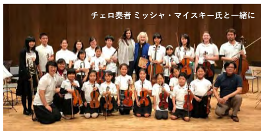
チェロ奏者 ミッシャ・マイスキー氏と一緒に