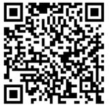
リモート合同コンサートの様子

2023年度JANPIA休眠預金を活用した本事業では「離島において、楽器の専門講師がICTを活用した定期的なリモート演奏指導と、3つの島(与那国島、渡嘉敷島、本島)を結んだリモート合同コンサートの実施。本事業の報告をまとめた冊子を作成し県内教育機関等へ送付」を目的に取り組みました。講師の訪島が難しい与那国町立久部良中学校吹奏楽部では演奏レベルの向上を目指し、渡嘉敷町立渡嘉敷中学校では楽器はあっても吹奏楽部がなく、希望者を募って初心者への指導を行い、2つのパターンを検証しました。その間に同時演奏の実験や映像送信方法の検討を行いました。2024年2月12日には琉球フィルが運営している那覇ジュニアオーケストラとともに3つの島を結んでお互いの音を聴きながら合同コンサートを行いました。