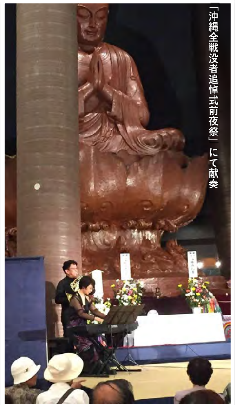
「沖縄全戦没者追悼式前夜祭」にて献奏