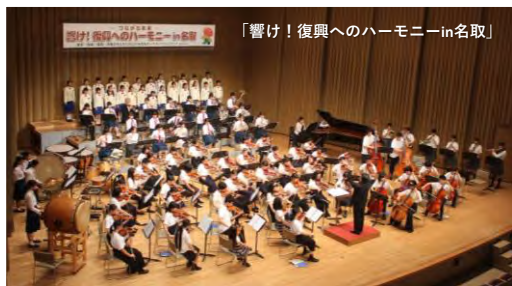
「響け！復興へのハーモニーin名取」

琉球フィルが運営する「那覇ジュニアオーケストラ」は、2013年10月より活動をスタートしました。団員是那覇市および県内各地の小学生から高校生で構成され、学校や学年の垣根をこえて「思いやり」と「感謝の心」を大切に、音楽活動を行っています。指導者には、琉球フィルハーモニックオーケストラのメンバーを中心に、プロの指揮者や演奏家を招き技術と音楽力の向上に努めています。これまでに1年間の練習成果を披露する定期演奏会の開催をはじめ、多くの演奏会等に出演。2016年には「第6回世界のウチナーンチュ大会」に出演。2015年より「ウィーン・フィル&サントリー音楽復興祈念賞」を6回受賞し、東日本大震災を風化させないことと、音楽による子どもたちの交流を目的に、2016年・2018年・2022年は沖縄県で、2017年と2019年に宮城県で『「響け！復興へのハーモニー～つながる未来～」岩手・宮城・福島・沖縄の子どもたちによる合同オーケストラコンサート』を開催しました。2020年には『いのちよ響け「奇跡のピアノ」沖縄コンサート～さとうきび畑とともに～』に出演。2020年、2021年にはハワイ州観光局支援のもと「ハワイ・ユース・シンフォニー」のチャリティコンサート「The Gift of Music」に、ハワイと日本の5つの姉妹都市のジュニアオーケストラとしてリモートによる共演に参加し、その模様はハワイのテレビ局KHNLの番組「Hawaii News Now」で放送されました。また、病院や施設などでの慰問演奏や、世界で活躍している一流音楽家との交流も行うなど、活動も多岐にわたっています。子どもたちは音楽をととした多様な体験により、心の豊かさを育み、喜びを分かち合える仲間の輪が広がっています。