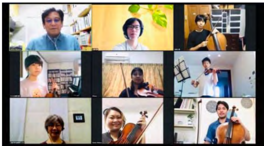
コロナ禍で自粛期間中那覇ジュニアオーケストラの子どもたちはリモートでレッスンを受けました。

離島の多い沖縄県において、ICTを活用した質の高い音楽教育を子どもたちや、学ぶ機会を求める人々に対し、効果的な学習環境などを提供できるよう取り組んでいます。