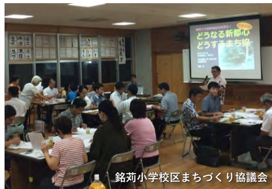
銘苅小学校区まちづくり協議会