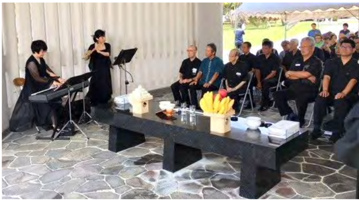
2017年より「国立戦没者墓苑 盆供養祭」にて献奏を行っています。

琉球フィルは、先の戦争で犠牲になった多くの御霊を弔い、平和を希求し、沖縄県平和祈念財団などと協力して平和発信に取り組んでいます。