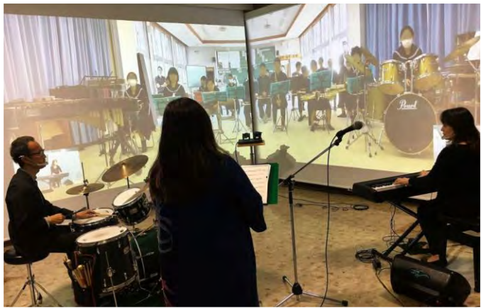
N T T西日本が取り組んでいる「アシタを変えるスマート光ソリューション」の空間と空間をつなぐ新たなコミュニケーション遠隔授業で使用している「SmoothSpace」活用した、与那国島の久部良中学校吹奏楽部との音楽交流実証実験の様子。(2021年2月4日N T T西日本沖縄支店 城間ビル1階ロビー)