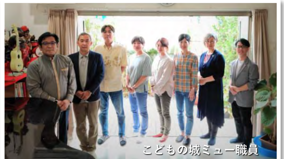
こどもの城ミュウ職員

また、中学校の生徒には、就労支援につながるよう社会性が経験できるよう促しています。