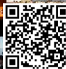
ハワイと日本の5つの姉妹都市のジュニアオーケストラとリモート共演